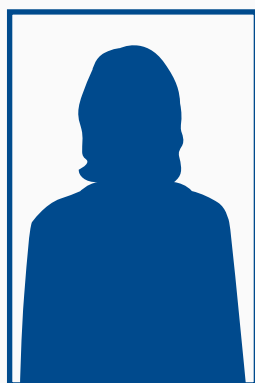
Mylène BERROD Conseillère en séjour Assistante Boutique